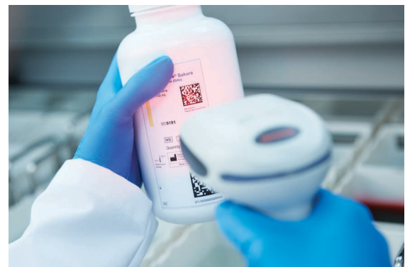
Escanee y rastree reactivos

Para rastrear los nuevos Kits de tinción de Sakura Finetek H&E y cumplir con los requisitos de CAP, los usuarios ahora pueden escanear el código de barras y registrar automáticamente la información de los kits de tinción y sus componentes en el software del sistema. Prisma Plus almacena y documenta la fecha y hora de vencimiento de los reactivos que fueron cargados en el instrumento, proporcionando otro nivel de seguridad para el paciente y documentación.