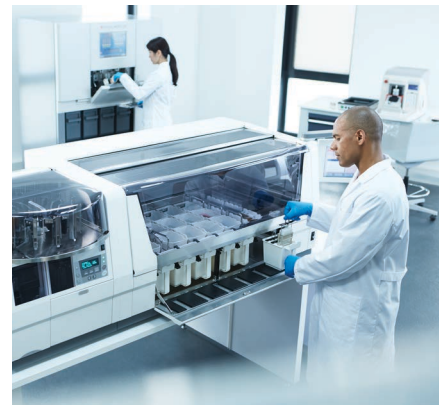
Cargue y descargue a su conveniencia

Conectar Prisma Plus con el montador de preparaciones con película cubreobjetos Tissue-Tek Film® o el cubreobjetos Tissue-Tek® Glas™ g2 crea un proceso de tinción integrado y totalmente automatizado, desde el horneado hasta el secado de la preparación. Los laboratorios ahora pueden aumentar aún más la productividad, apreciada especialmente durante las horas pico de demanda diarias. También se reduce el nivel de estrés del usuario, quien puede enviar preparaciones teñidas y montadas de alta calidad más rápido a los patólogos.