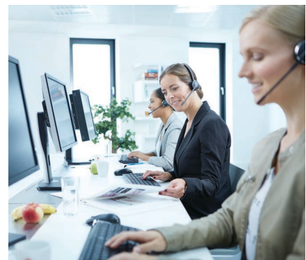
Mantenimiento y soporte confiables

Para aumentar aún más esta confiabilidad sin precedentes, Prisma Plus ahora incluye Tissue-Tek iSupport ™, la última tecnología en diagnóstico y monitoreo remoto para su Prisma Plus . iSupport está disponible para proporcionar la respuesta más rápida posible a su laboratorio y obtener el máximo tiempo de productividad.