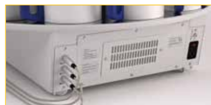
Filtro de carbón activo